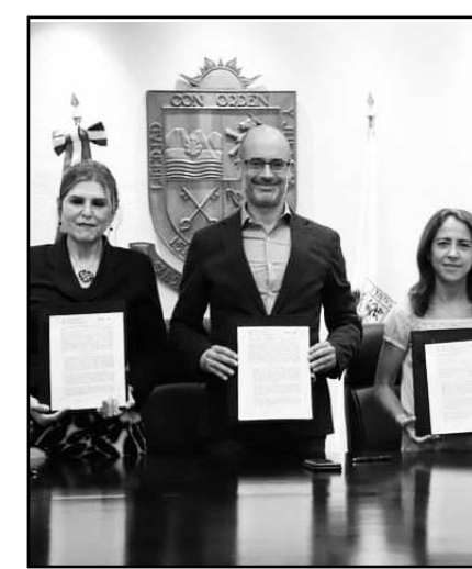
Se firmó el convenio